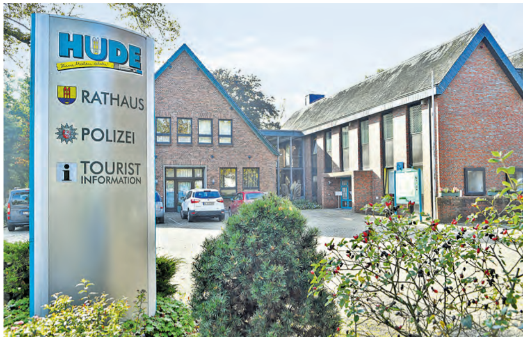
In einer Ratssitzung wird am Donnerstag über feste und mobile Filter für Raumluft abgestimmt.

In der Schule Jägerstraße geht es um einen Werk- und einen Besprechungsraum, in der katholischen Grundschu-